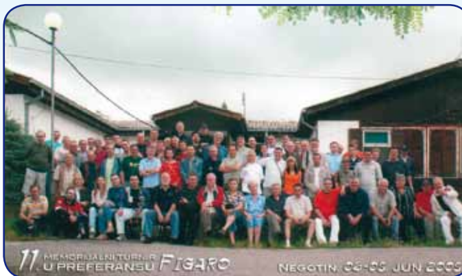
FOTOGRAFIJA UČESNIKA XI TURNIRA, jun 2008.god.